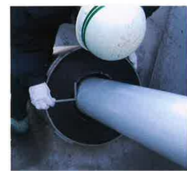
実橋における適用例(隙間確認状況)