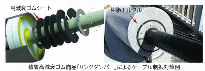
高減衰ゴムシート