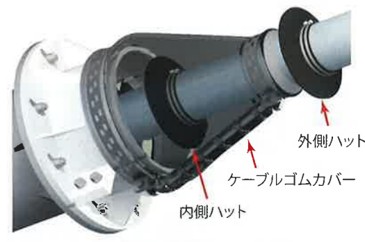
ハットをゴムカバー内側と先端外側に併設したイメージ