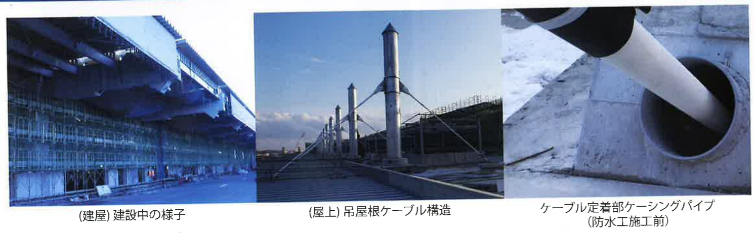
(建屋) 建設中の様子